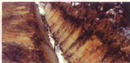
En creusant le fossé en forme de « V », l'écoulement de l'eau est facilité et les risques d'érosion sont peu élevés.

La première étape à réaliser sur le terrain est le déboisement du couloir forestier où sera creusé le fossé. La largeur déboisée varie selon la machinerie utilisée. L'opérateur peut ensuite procéder au creusage des canaux, en forme de « V » plutôt que de « U », afin de faciliter l'écoulement et diminuer les risques d'érosion.