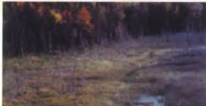
Il faut parfois attendre longtemps avant que des arbres poussent dans une tourbière drainée.

Les terrains tourbeux peuvent également être drainés. Toutefois, l'opération n'est pas toujours rentable. Il faut beaucoup de temps avant que des semis réussissent à se développer dans ces milieux puisque la couche épaisse de tourbe doit d'abord se décomposer. Pensez plutôt à drainer les sites humides où il y a déjà des arbres sur place. Les résultats seront meilleurs et plus rapides.