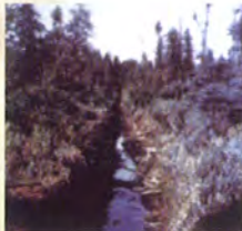
Les arbres de ce boisé sont rabougris et leur croissance est faible; le drainage augmentera leur croissance et un volume de bois plus élevé pourra donc être obtenu lors de la récolte de la forêt. Source: FPBQ

La mise en place d'un réseau de drainage nécessite souvent la participation de plusieurs propriétaires. En effet, si aucun cours d'eau naturel ne traverse votre lot, le fossé principal devra se jeter dans celui du voisin. Mais il se peut que le voisin ne possède pas de fossé à l'endroit désiré. Vous devrez alors lui proposer de s'en creuser un pour permettre le drainage de votre terrain!