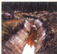
Pour minimiser l'érosion du fossé de drainage, le changement de direction est arrondi.