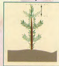
Une petite pousse terminale indique une faible croissance de l'arbre au cours de la dernière année.

En plus de vérifier si les arbres peuvent réagir au drainage avant de débiter le traitement, vous devez évaluer s'il est vraiment nécessaire de le faire. Par exemple, lorsque le niveau de l'eau est près de la surface du sol pendant une bonne partie de l'année dans votre forêt, il pourrait être très avantageux d'y faire un drainage. Remarquez aussi la croissance de vos arbres, car certaines espèces se développent mieux dans les milieux plus humides. Si la pousse terminale est courte sur la majorité des tiges et que celles-ci présentent un certain jaunissement, c'est que leur croissance est faible. Il est très probable que l'accumulation d'eau en soit la cause.