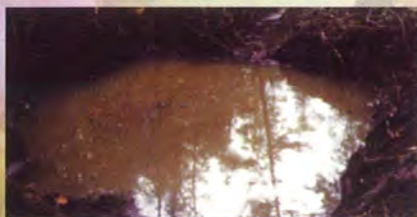
Ce bassin de sédimentation contient beaucoup de particules en suspension qui s'y déposeront sans parvenir au cours d'eau principal. La qualité de l'eau est donc maintenue puisque les sédiments ne viendront pas l'obstruer.

À environ 20 mètres avant la fin du canal principal, vous devez creuser un bassin de sédimentation. Il s'agit d'un « petit lac » qui sert à ralentir la vitesse de l'eau avant son arrivée dans le cours d'eau naturel principal. Sa superficie minimale doit être de 1 m 2 par 100 mètres de longueur de votre fossé, mais un minimum de 20 m 2 par bassin doit être respecté. Par exemple, si votre réseau de drainage a une longueur de 100 mètres, le bassin de sédimentation