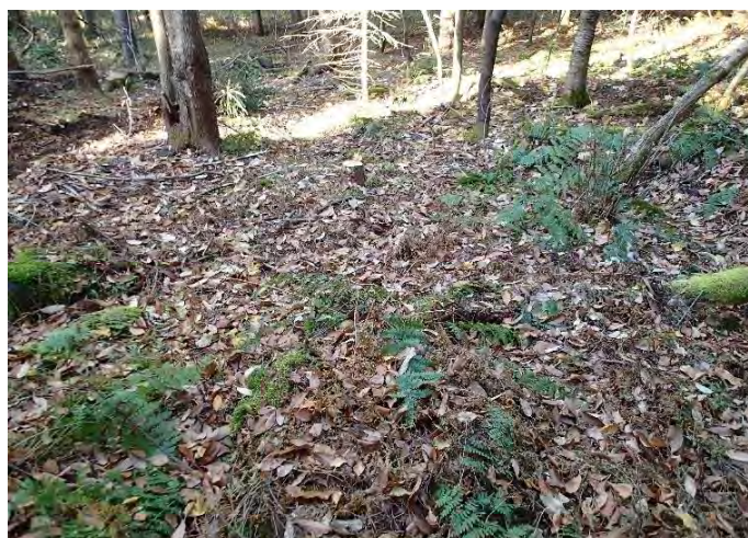
Sol forestier avant le scarifiage

Ainsi, la prescription sylvicole cible un prélèvement de 35% de la surface terrière du peuplement (30-40%). La priorité de récolte est le sapin baumier (retirer 100%) et l'épinette blanche (retirer 35%). Le travail doit être effectué à l'aide d'une petite multifonctionnelle avant le gel automnal, donc au cours de l'été ou de l'automne 2015. L'occupation des sentiers peut dépasser la norme standard de 15% puisque l'objectif principal, à part l'ouverture du couvert, est la perturbation de l'humus. Suite à la récolte, une petite pelle mécanique devra créer des microsites favorables à la germination sur environ 50% de la superficie des zones traitées, en incluant les sentiers de débardage. Il s'agit d'un scarifiage en placeaux par décapage de la matière organique. L'objectif est d'obtenir une densité d'épinette supérieure à 1000 tiges par hectare d'ici 5 ans. Un coefficient de distribution de 50% est la cible