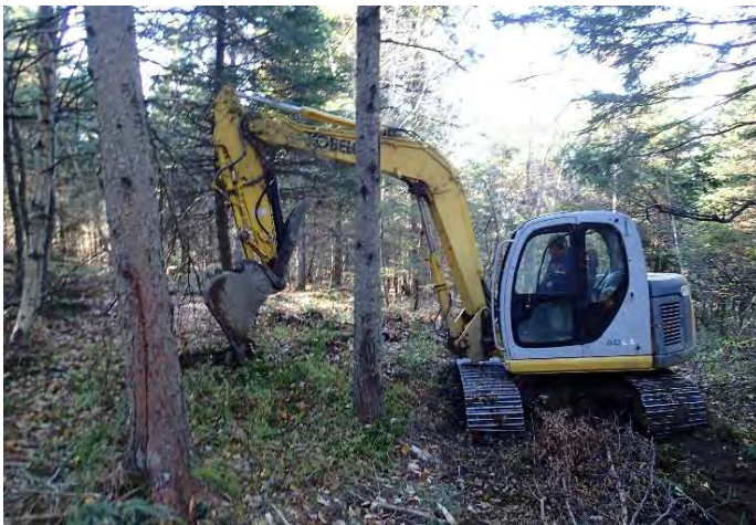
Pelle mécanique utilisée pour le scarifiage (Kobelco – 80CS)

Les opérations de scarifiage par placeaux ont été effectuées à l'aide d'une pelle mécanique appartenant au propriétaire du lot forestier. Il s'agit d'une petite machine de la compagnie Kobelco, modèle 80CS, qui mesure 2,5 m de largeur et pèse 8000 kg. À la suite du scarifiage, nous avons estimé le coefficient de distribution des microsites adéquats à 62% en incluant les sentiers de débardage possédant les caractéristiques adéquates. Le coefficient de distribution se base sur un échantillonnage considérant un plein boisement de 2500 tiges/ha soit un rayon de 1,13 mètre.