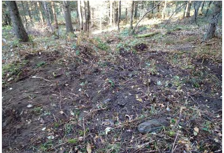
Sol forestier après le scarifiage

La coupe a permis de réduire la surface terrière aux alentours de 24 m 2 /ha. Cela correspond à un prélèvement d'environ 23-25% de la surface terrière du peuplement. L'ingénieur forestier en charge du martelage a choisi de réduire légèrement le prélèvement sur le terrain pour éviter les risques de chablis. Le peuplement est vulnérable aux vents d'ouest et situé à mi-pente. Les proportions de représentativité entre les essences sont demeurées sensiblement les mêmes, quoique l'ensemble des sapins baumiers aient été récoltés. Il reste, après traitement, 364 tiges/ha d'épinettes blanches de plus de 20 cm au DHP dont 39 tiges/ha de plus de 30 cm.