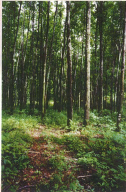
Les arbres d'avenir doivent être en bonne santé, avoir une tige droite et une cime bien développée.

Le but fondamental de l'éclaircie commerciale est d'orienter la sélection naturelle des arbres vers les plus vigoureux. Vous devez donc choisir les arbres les plus sains et les plus droits, dont la cime est assez développée pour réagir au traitement sylvicole. On les appelle les arbres d'avenir. Vos choix doivent aussi se porter sur les espèces d'arbres désirées par le marché du sciage, puisque l'éclaircie vise aussi à améliorer la qualité du bois.