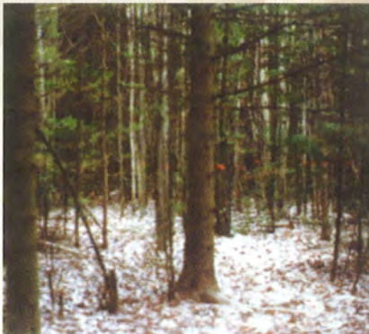
Au moment de l'éclaircie, les tiges qui nuisent à la croissance des arbres d'avenir sont récoltées. Elles sont identifiées avant la coupe avec de la peinture ou des rubans.