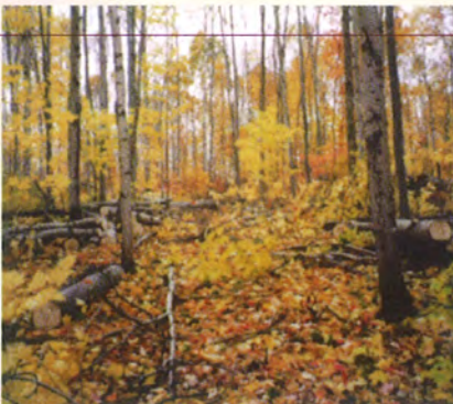
Avec plusieurs sentiers de débardage, il est plus simple de sortir le bois coupé sans blesser les tiges qui demeurent sur pied.