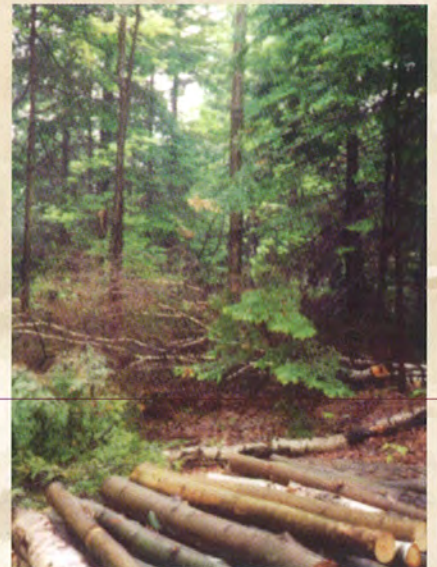
Éclaircie commerciale dans une forêt mélangée.

Sylviculture d'un boisé privé , 1989. OPBRQ, CERFO.